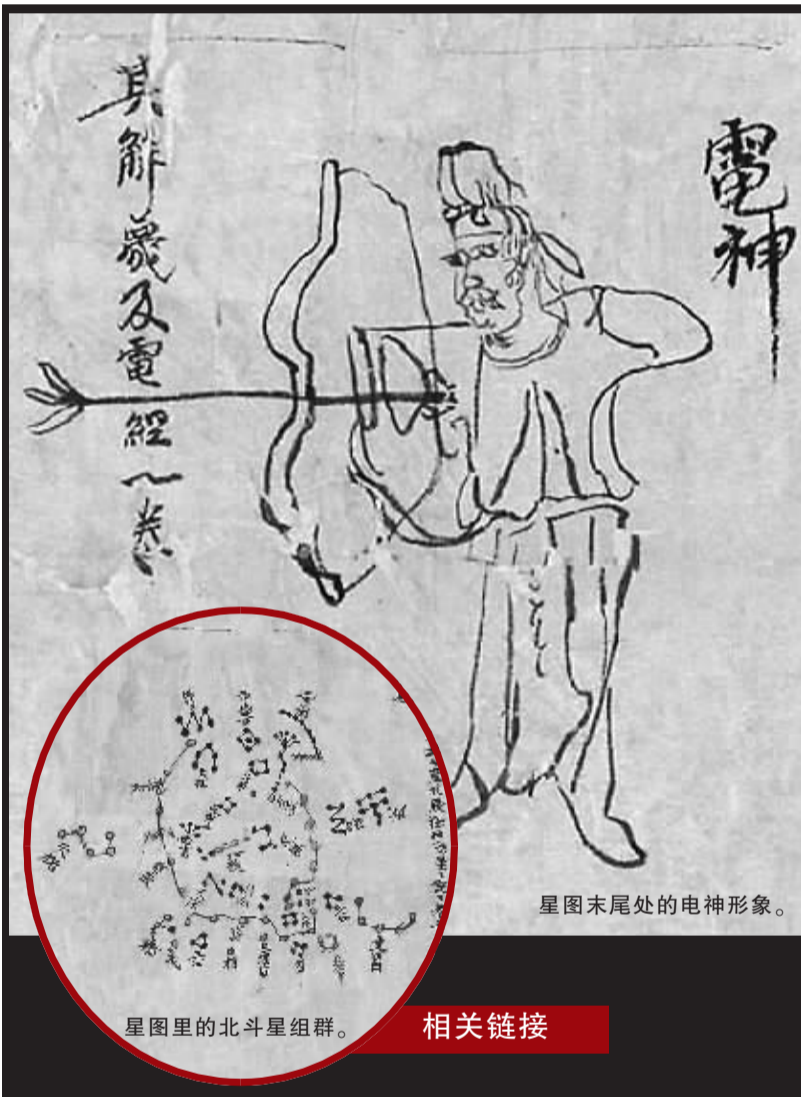
星图末尾处的电神形象。

我国的学者对这张星图的研究始于上个世纪60年代。著名的古天文史专家席泽宗曾在1966年撰文指出，星