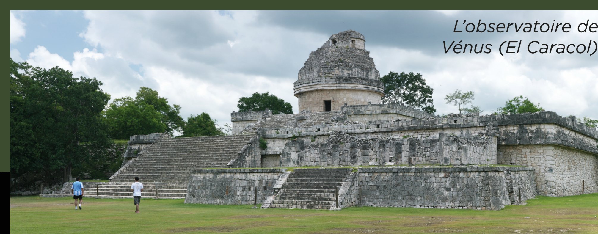
L'observatoire de Vénus (El Caracol)

Dans le monde des Mayas, en Amérique centrale, il y a plus de mille ans, le combat du feu et de la pluie détermine la destinée du Monde. Dans le grand livre secret des Indiens mayas Quichés, le Popol-Vuh (1550), est décrite l'émergence du Monde à partir des eaux, sous l'action des esprits. La dernière création est celle du feu qui rendit tout possible.