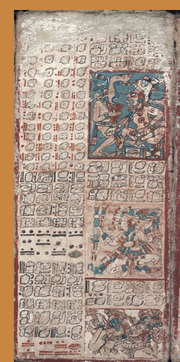
Codex de Dresde

La tour d'observation, baptisée «El Caracol» (l'escargot), à Chichen Itza (Yucatan Mexique), était consacrée principalement à la planète Vénus. Les Mayas avaient basé leur calendrier sur Vénus et les différentes ouvertures de la tour sont orientées pour observer les levers et couchers de la planète. Le codex de Dresde, en hiéroglyphes mayas, est un des rares traités astronomiques mayas encore existant.